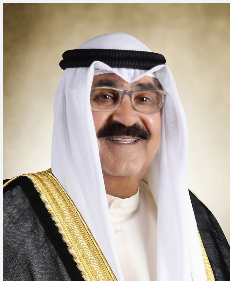
سمو الشيخ مشعل الأحمد الجابر الصباح ولي عهد دولة الكويت