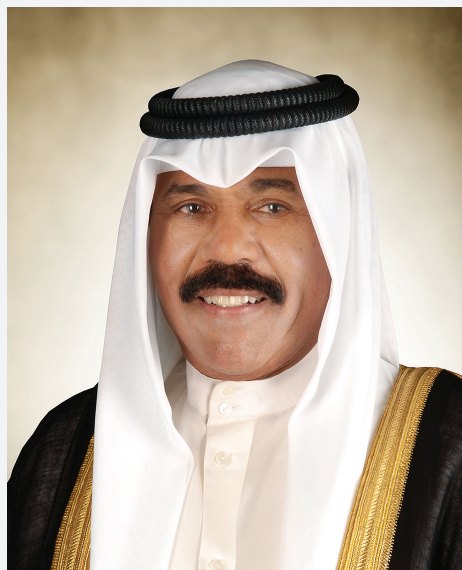
حضرة صاحب السمو الشيخ نواف الأحمد الجابر الصباح أمير دولة الكويت